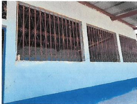
Foto1: mantenimiento de balcones (limpieza y pintura)