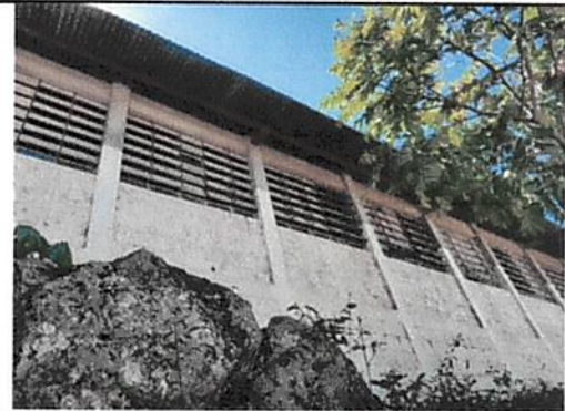
Foto 10: Reemplazo de de ventanas de metal por ventana de bandera